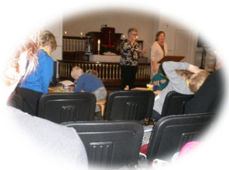
Vi synger julen ind sammen med spejderne