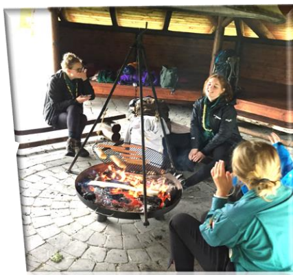
Glade spejdere på sommerlejr