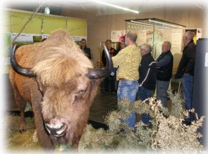
Mand-i-Fest på Naturbornholm